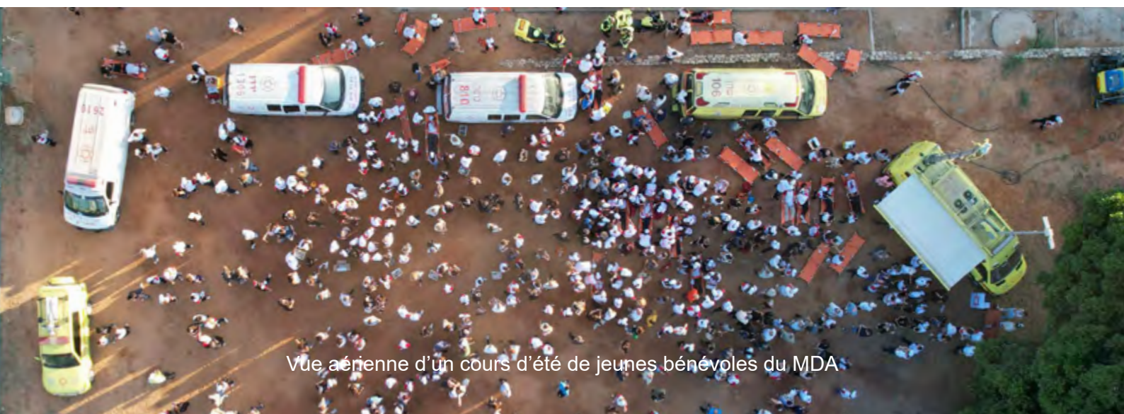
Vue aérienne d'un cours d'été de jeunes bénévoles du MDA